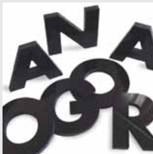
Recorte em acrílico