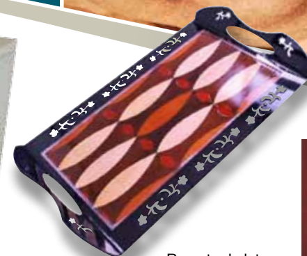
Recorte de letras, detalhes e peças sofisticadas

refrigeração por "chiller", soprador de ar, sistema exaustor de gases e programa operacional. Importa arquivos da maioria dos programas gráficos, textos e fotos (vide abaixo). Trabalha diretamente com Corel e CAD. Potências de canhão de 60 à 140W possibilitam melhor seleção para suas aplicações.