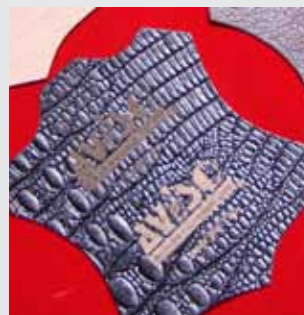
Recorte e Gravação em couro